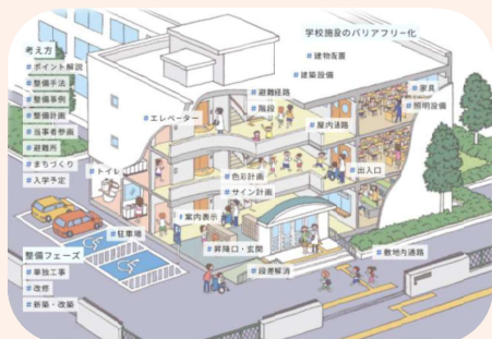
学校バリアフリーガイド(サイトイメージ)